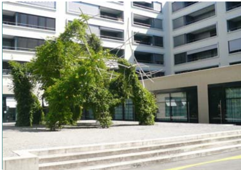
HOTELHOF Rankgerüst aus Edelstahl