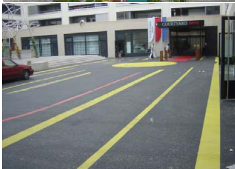
Markierung Hotelvorfahrt mit Abtrennung öffentlicher Fussweg. Integration von überfahrbaren Bodenleuchten